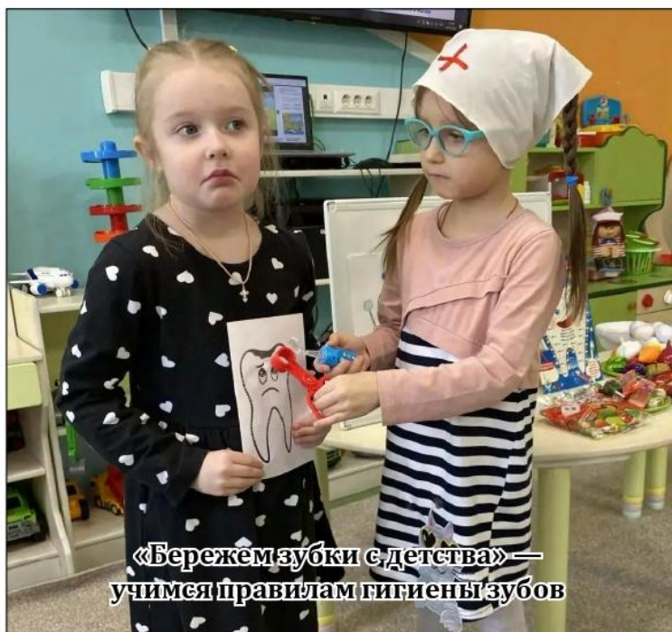
«Бережем зубки с детства» — учимся правилам гигиены зубов