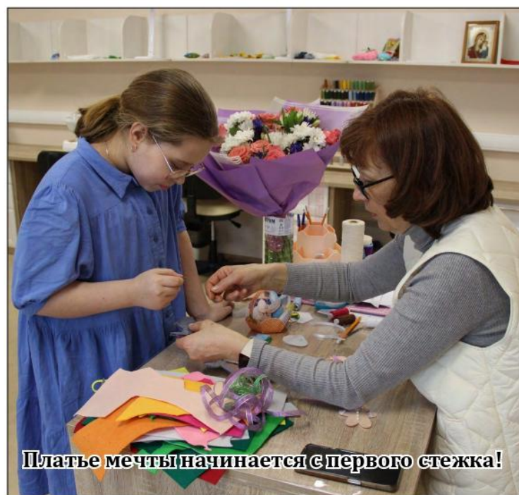
Платье мечты начинается с первого стежка!