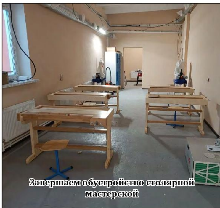
Завершаем обустройство столярной мастерской