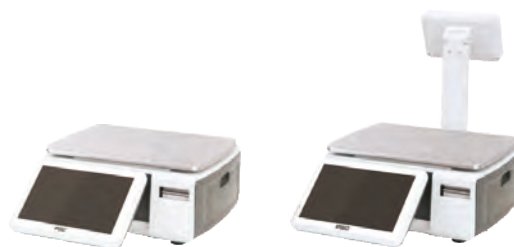
С ДИСПЛЕЕМ ПРОДАВЦА 10" И ПОКУПАТЕЛЯ 7" НА СТОЙКЕ И БЕЗ