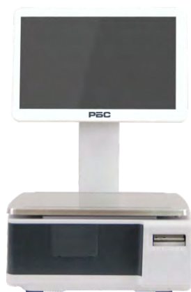
ВЕСЫ САМООБСЛУЖИВАНИЯ С ДИСПЛЕЕМ 15 "