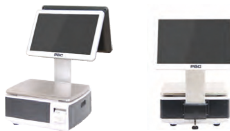
С ДИСПЛЕЕМ ПРОДАВЦА 15" И ПОКУПАТЕЛЯ 15" НА СТОЙКЕ