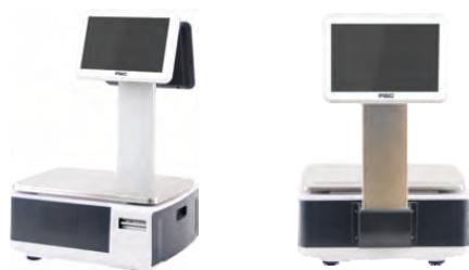
С ДИСПЛЕЕМ ПРОДАВЦА 10" И ПОКУПАТЕЛЯ 10" НА СТОЙКЕ