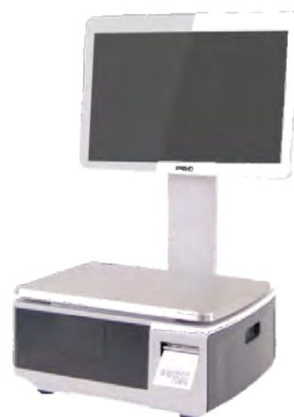
ВЕСЫ САМООБСЛУЖИВАНИЯ С ДИСПЛЕЕМ 18 "