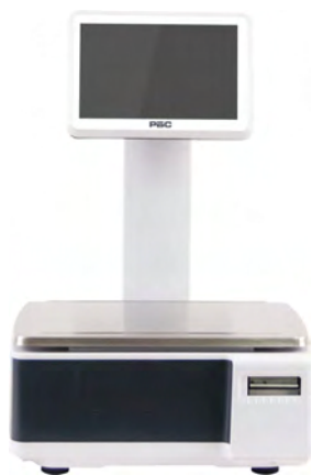
ВЕСЫ САМООБСЛУЖИВАНИЯ С ДИСПЛЕЕМ 10 "