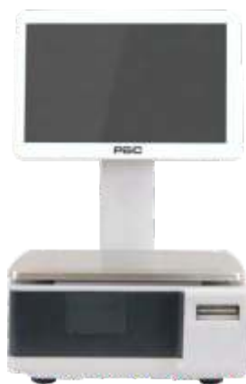
ВЕСЫ САМООБСЛУЖИВАНИЯ С ДИСПЛЕЕМ 15"