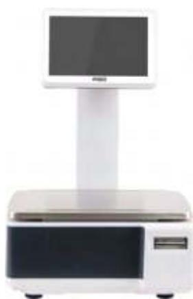
ВЕСЫ САМООБСЛУЖИВАНИЯ С ДИСПЛЕЕМ 10"