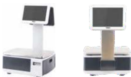
С ДИСПЛЕЕМ ПРОДАВЦА 10" И ПОКУПАТЕЛЯ 10" НА СТОЙКЕ