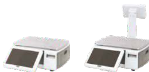
С ДИСПЛЕЕМ ПРОДАВЦА 10" И ПОКУПАТЕЛЯ 7" НА СТОЙКЕ И БЕЗ