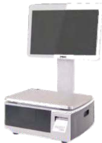
ВЕСЫ САМООБСЛУЖИВАНИЯ С ДИСПЛЕЕМ 18"