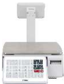
С ДИСПЛЕЕМ ПРОДАВЦА И ПОКУПАТЕЛЯ 4,3" + ТАКТИЛЬНЫЕ КНОПКИ