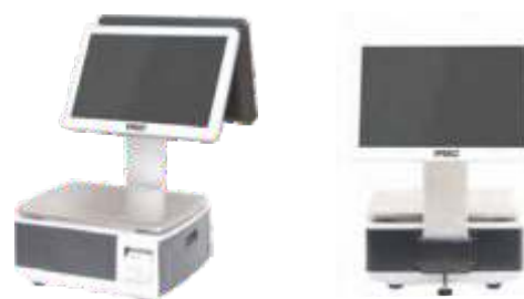
С ДИСПЛЕЕМ ПРОДАВЦА 15" И ПОКУПАТЕЛЯ 15" НА СТОЙКЕ