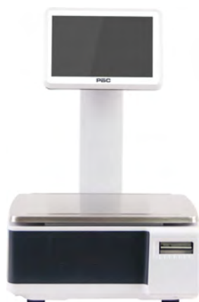
ВЕСЫ САМООБСЛУЖИВАНИЯ С ДИСПЛЕЕМ 10"