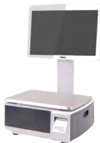
ВЕСЫ САМООБСЛУЖИВАНИЯ С ДИСПЛЕЕМ 18"