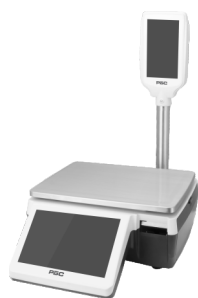
С ДИСПЛЕЕМ ПРОДАВЦА 10" И ПОКУПАТЕЛЯ 7" НА СТОЙКЕ