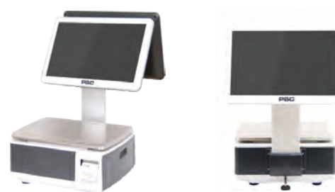
С ДИСПЛЕЕМ ПРОДАВЦА 15" И ПОКУПАТЕЛЯ 15" НА СТОЙКЕ