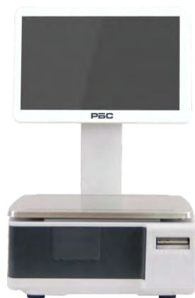
ВЕСЫ САМООБСЛУЖИВАНИЯ С ДИСПЛЕЕМ 15"